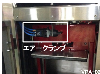
ワンタッチでロックができる エアークランプ式