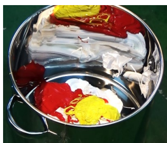
① 混ぜる物を容器に入れる