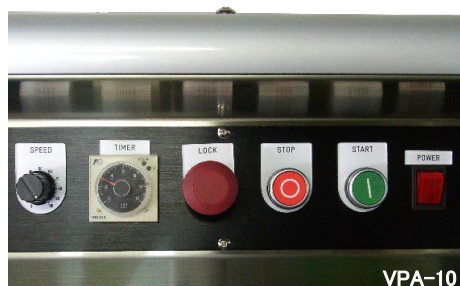
使いやすく設計されたスイッチパネル