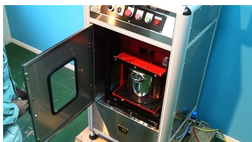
② 容器にフタをして、VPシリーズにセット