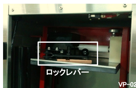
お求めやすさを優先して考えた 低価格モデルのロックレバー式