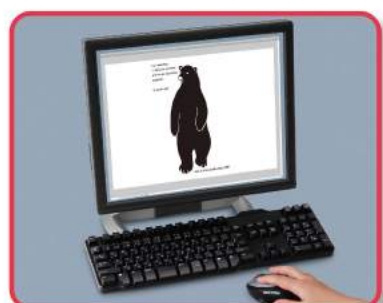
① パソコンでデータ作成