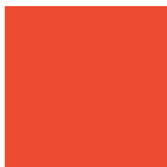
UPLC2050 UNIMIX ORANGE