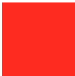
UPLC3100 UNIMIX NEON RED