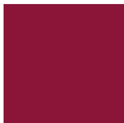
UPLC4008 UNIMIX CERISE