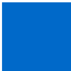
UPLC5100 UNIMIX NEON BLUE