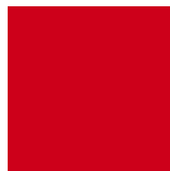
UPLC3005 UNIMIX RED (YS)