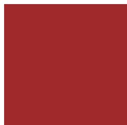
UPLC3000 UNIMIX RED (BS)